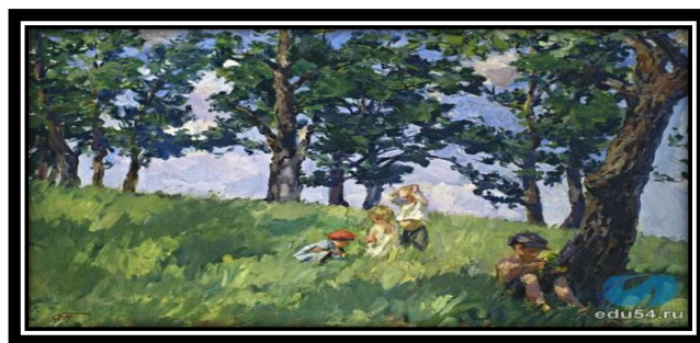
Картина «Пора ягод» А. Пластов 1938-39 г.г.

Представляем вашему вниманию мини-галерею «Память в наших сердцах». Репродукция картин разная, но объединена в общую тему о Великой Отечественной войне.